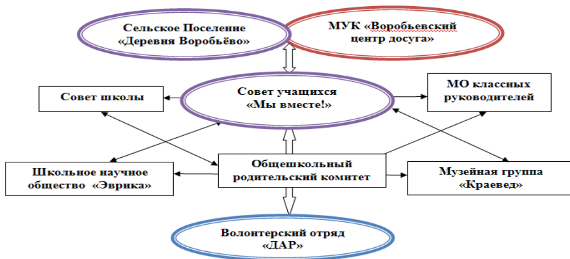
Структура взаимодействия Совета учащихся «Мы вместе» и волонтерского отряда «ДАР»